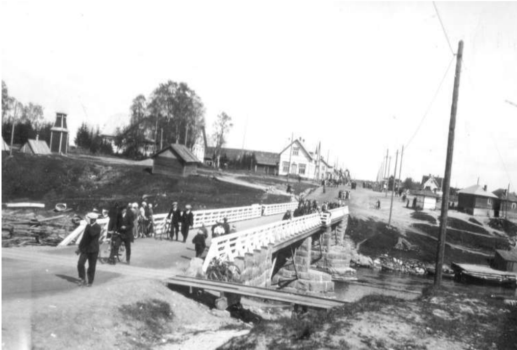
Tuleman kirkonkylä ja silta