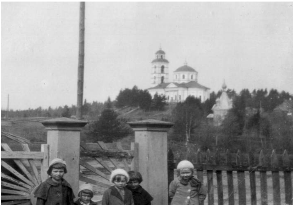
Ortodoksikirkko ja Scheynin kappeli Tuleman Hovin pihalta nähtynä.