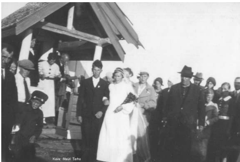
Lunkulan tsasouna. Hääpari.

Olin sitten iltapäivällä serkkupoikani häissä kruunun kantajana ja kun palattiin illan hämärässä, pyyhki Mantsinsaaren rantaa voimakkaan valonheittäjän kiila. Se ei ollut vielä mitään, mutta seuraavana aamuna syttyi talvisota (NK 8-1995, Vilho Halmekari ).