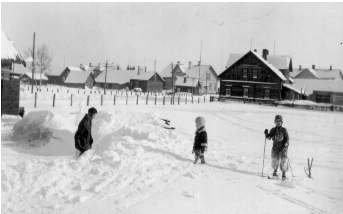
Tuleman kirkonkylää, musta talo on Sutisen.