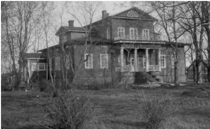
Tuleman Hovi. Kuva on Tulemajoen puolelta.