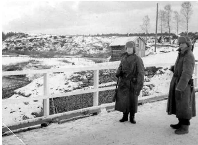
Räimälän silta marraskuussa 1939.