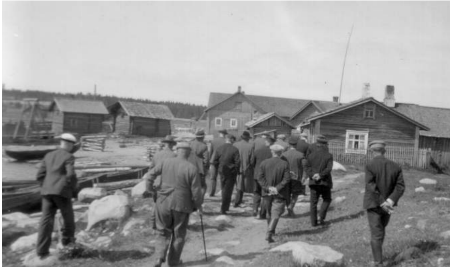
Katselmus Tulemajoen varrella