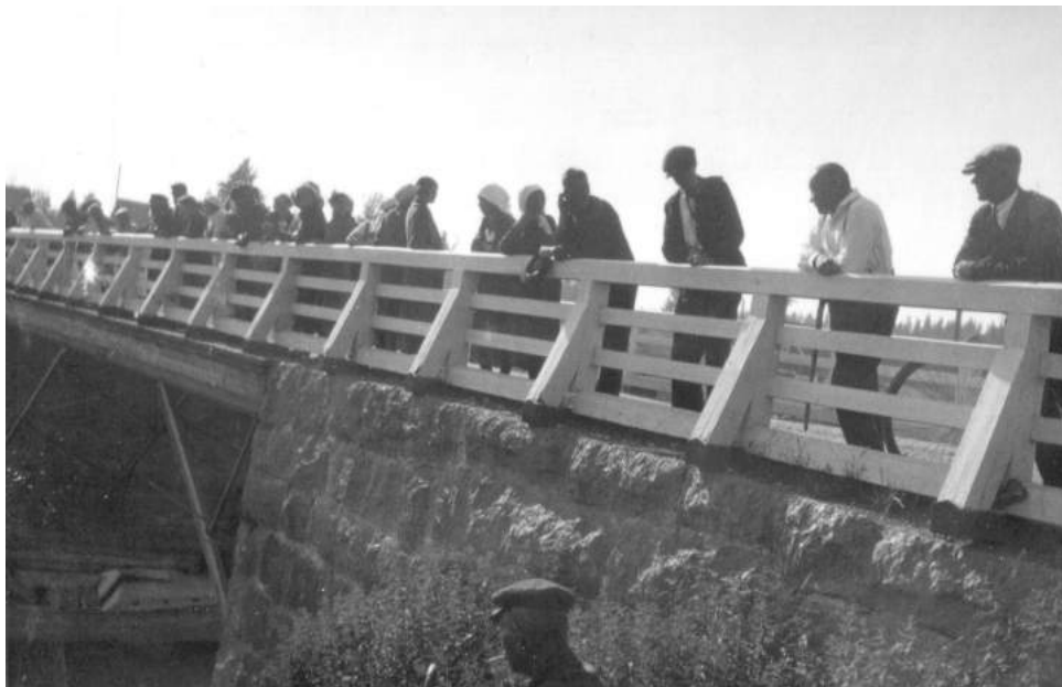
Kyöläyksen katsojia Tuleman sillalla

29.11.1939 selvisi, että laivasto ei pysty toimimaan itärannikon tuntumassa, koska siltä puuttuu joukkoja ja tukikohtia. Näin ollen laivaston päällistö oli silloin sitä mieltä, että sen tehtäväksi on jäänyt tukea tykistötuella 7. armeijan sivustoja ja suojata sitä järven suunnalta tapahtuvilta hyökkäyksiltä sekä tuhota vihollisen laivasto (Smi).