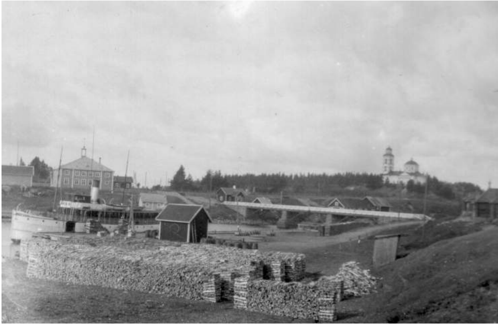
Salmin satamaa ja taustalla Ortodoksikirkko.