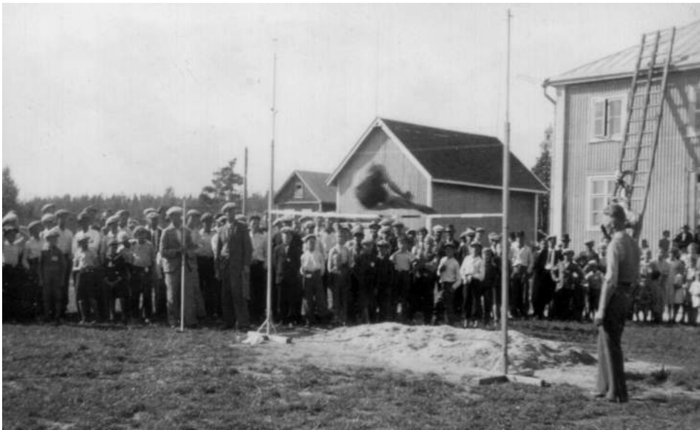
Urheilukilpailut Tulemalla kesällä 1939