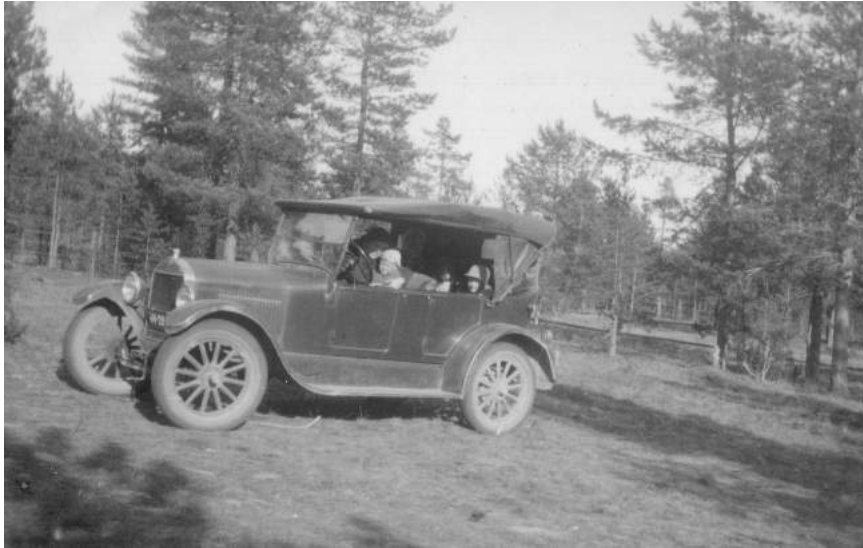
Terhon Maxwell Sydämaan rantatontilla.