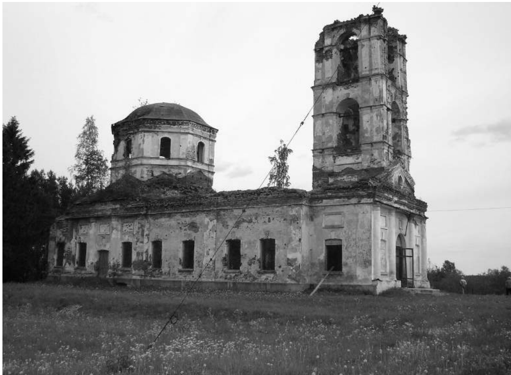
Salmin Nikolauksen kirkon rauniot Tulemalla.