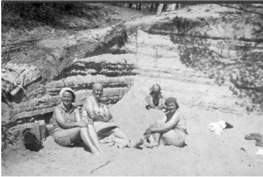
Laatokan rantapenkereen hiekkakerrostumaa. Rinnesaunan pohja on kaivettu.