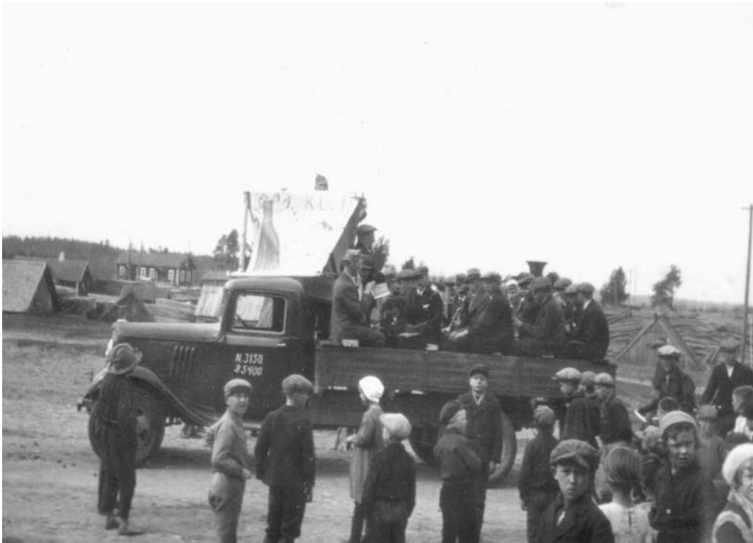
Vappu 1936, orkesteria johtaa Olavi Hyöky