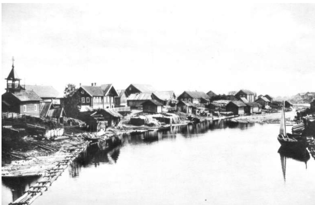
Miinalan kylä, kuva postikortista