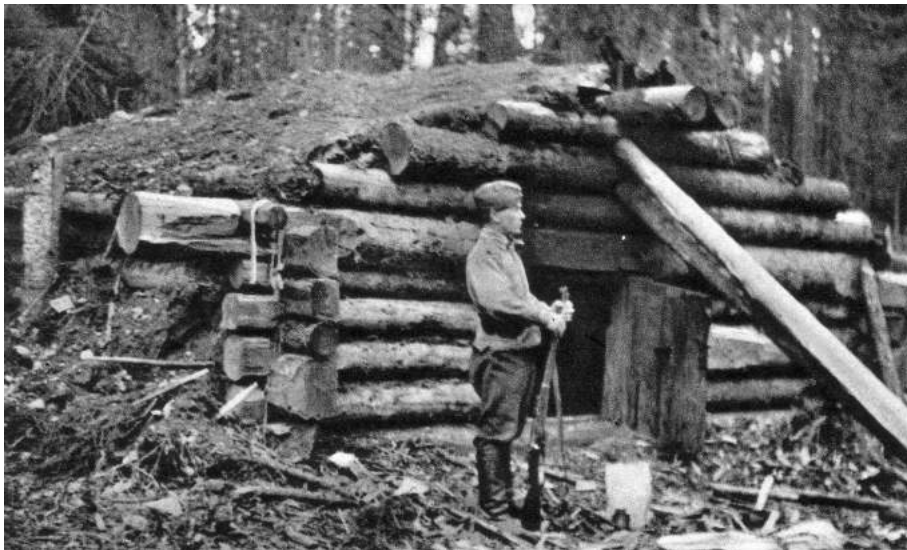
Kiviojan kämppä

Aamulla 30. päivä marraskuuta olivat Hämäläiset ja Onniselkä aloittaneet taas savotan joen varressa, kun kuulivat ammuntaa ja tykkien jyskettä rajalta. Kun työnjohtaja Sotti ei normaaliin tapaansa ollut saapunutkaan työmaalle, lähtivät he keskipäivän aikaan takaisin Palojärven suuntaan. Tultuaan Palojärven koulun kohdalle, porukka hajaantui. Hämäläiset ja Eskelinen lähtivät Vipuveräjän aukealla sijaitseviin koteihinsa. Muut aikoivat majoittua entiseen tapaan Jekkosen taloon. Jekkoseen mennyt porukka kuitenkin havaitsi, että Vipuveräjän pelloille oli aamulla tullut useita kranaatteja. Aukkaat olivat sieltä paenneet alusvaatteisillaan kirkonkylään päin.