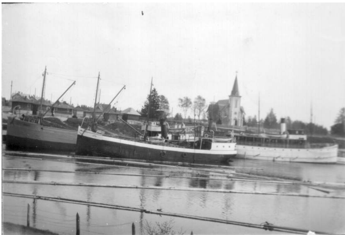
Tuleman satamaa, laivat Kannas , Utu, Ernie ja Otava