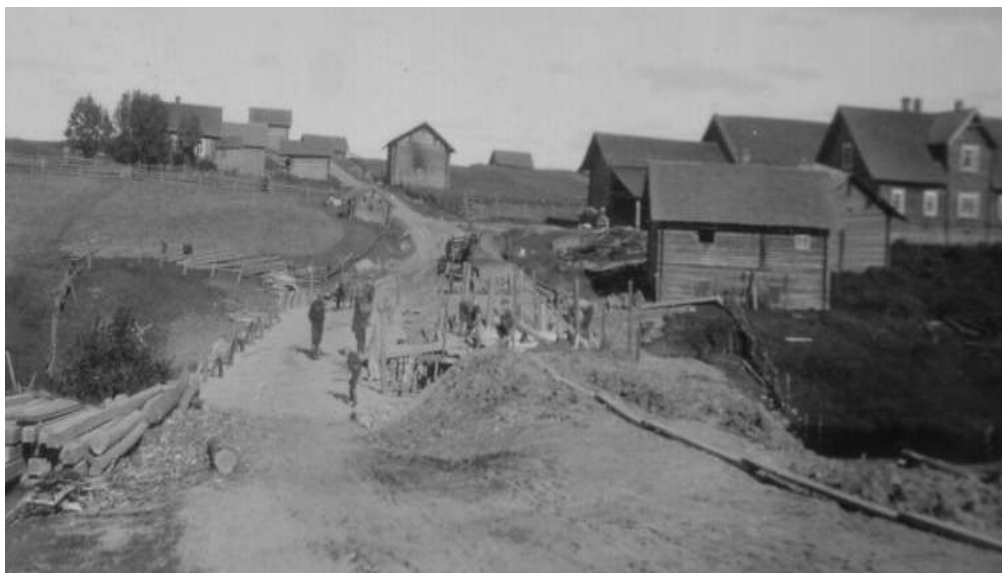
Varpaelän siltaa rakennetaan.