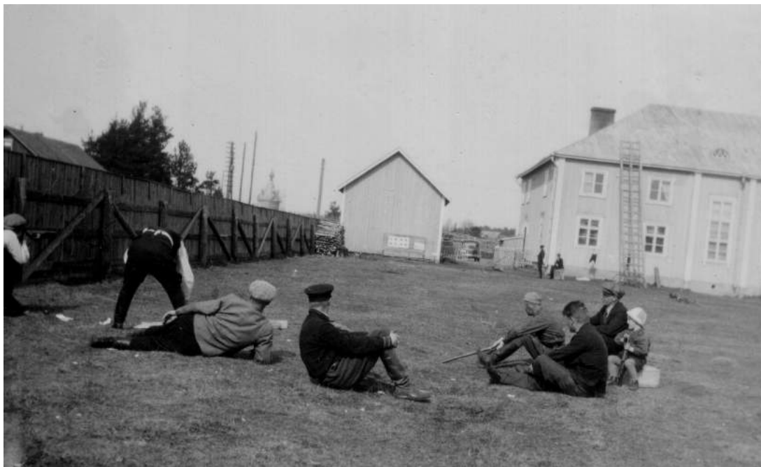
Ampumarjoitukset Tulemalla vuonna 1937

5000-6000 henkeä. Tämä lienee vaatinut ainakin viisi evakuointijunaa.