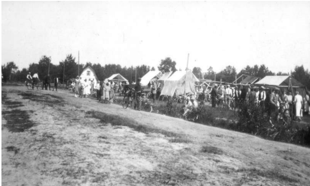
Praasniekat Tulemalla juhannuksena 1939