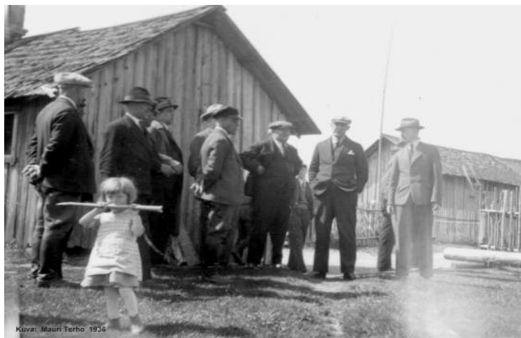
Tilannetta harkitaan. Kuvat vuodelta 1936