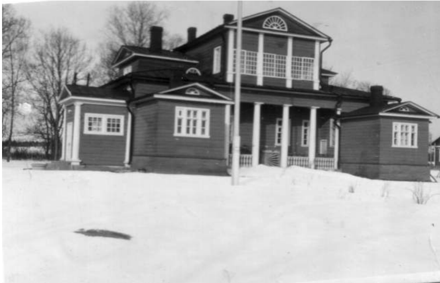
Tuleman Hovi oli Salmin nimismiehen virka-asunto. Kuva on pihan puolelta.