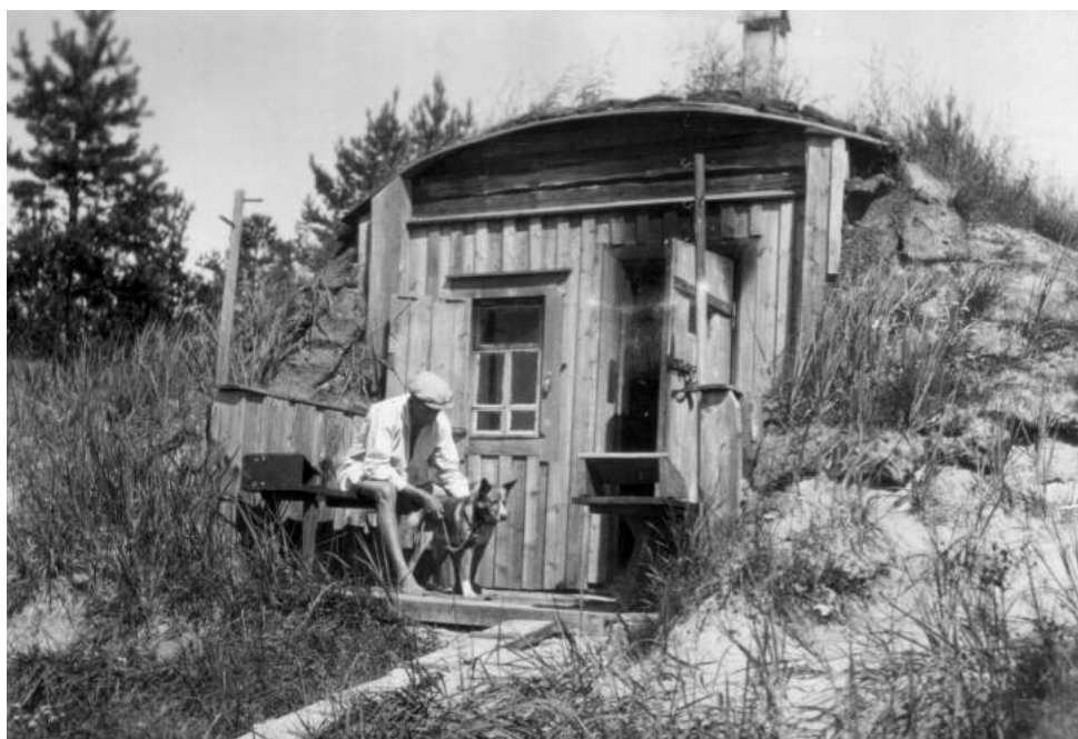
Nimismies Terho ja Vahti-koira tyypillisen Laatokan rinnesaunan edessä

tavaksi ajalla 30.11-1.12, mutta kuitenkin niin, että Lunkulan- ja Mantsinsaari sekä Tuleman ja Kirkkojoen kylät vasta 3.12 mennessä. Joulukuun 1. pnä klo 18 annettiin uusi käsky, jossa evakuointi määrättiin suoritettavaksi 5.12 mennessä alueelta Ylä-Uuksu–Näätäoja–Ägläjärvi. Ristiriita evakuoinnin toteutus-aikataulussa oli selvä ja siitä aiheutui siviiliväestölle edellä mainittuja vaikeuksia varsinkin Karkun kylässä.