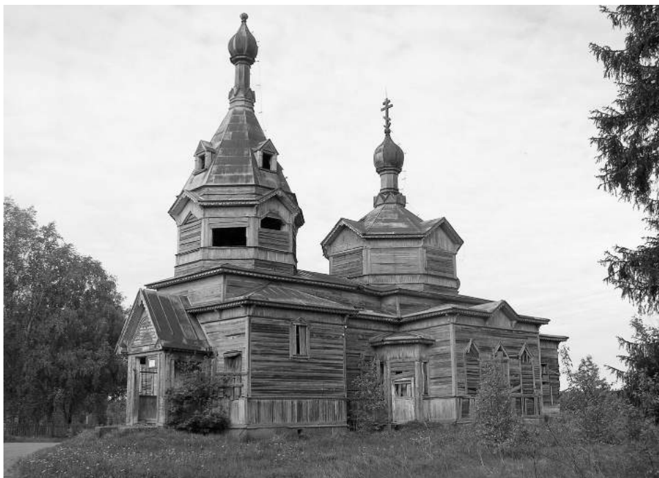
Orusjärven kirkko. Paikalla on ollut luostari 1500/1600-luvun vaihteessa.