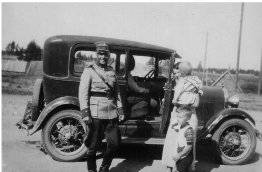
Autoilua Salmassa Tulemajoen rannalla