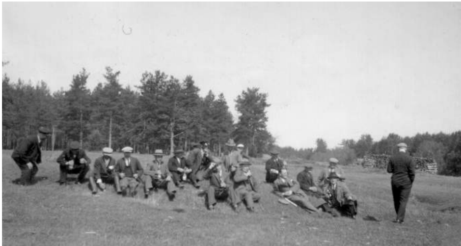
Lepotauko katselmuksen aikana