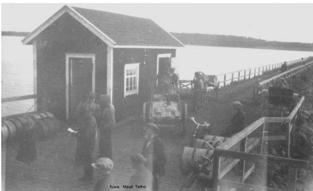
Mantsinsaaren pitkä laituri, takana Mantsinsaari