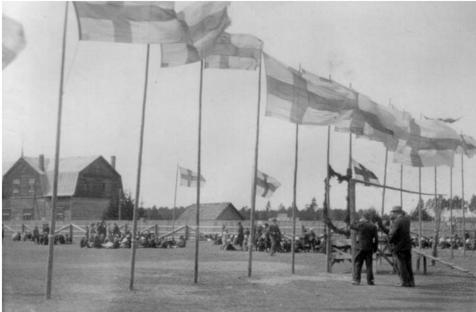
Juhlat Tulemalla 16.5.1935

lääninhallitus määräyksen evakuoida Salmin rajakylät eli Kaunoselkä, Käsäselkä, Manssila, Rajaselkä, Kanabrojärvi, Orusjärven osia (Murtojärvi, Vorjenselkä) ja Virtelä. Tämä oli edellisiin tapahtumiin nähden pakollinen toimenpide ja tapahtui viranomaisten järjestämänä (MT).