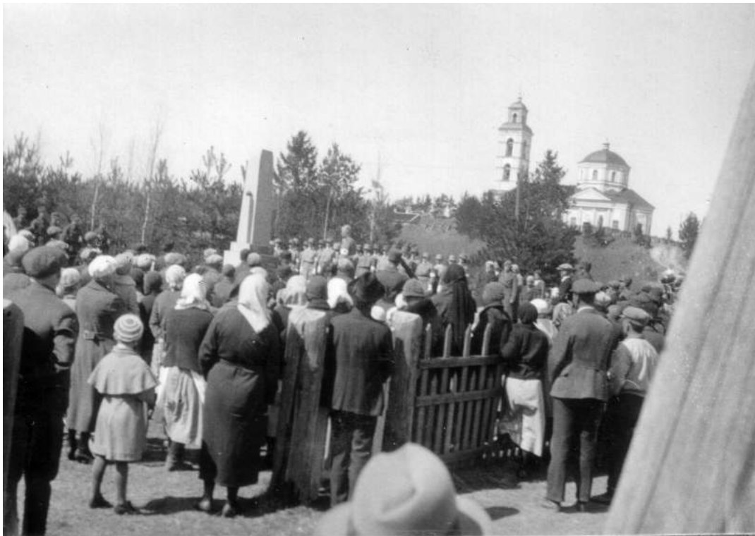
Tilaisuus Vapaussodan muistomerkillä 16.5.1935