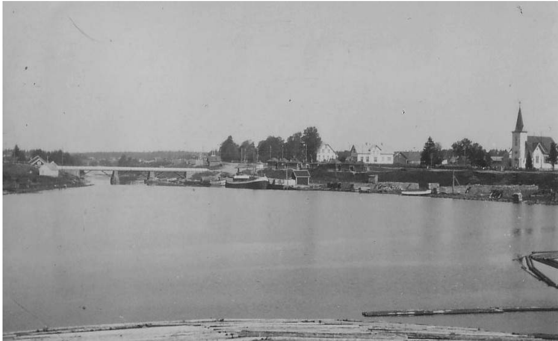
Tuleman satamaa, taustalla luterilainen kirkko