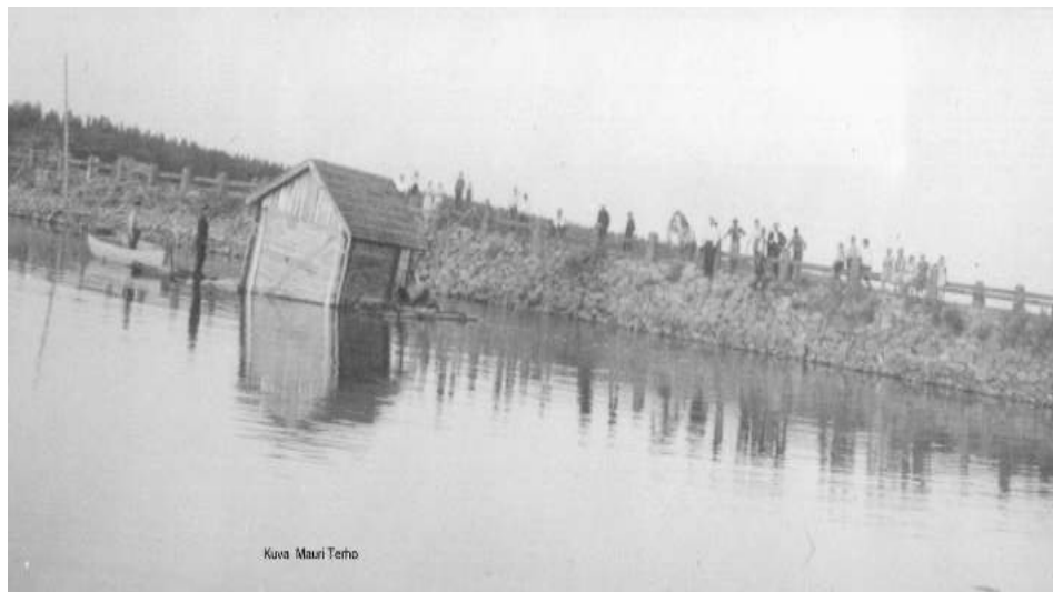
Saunaa uitetaan Lunkulansaaresta. Taustalla Perämaan pengertie.