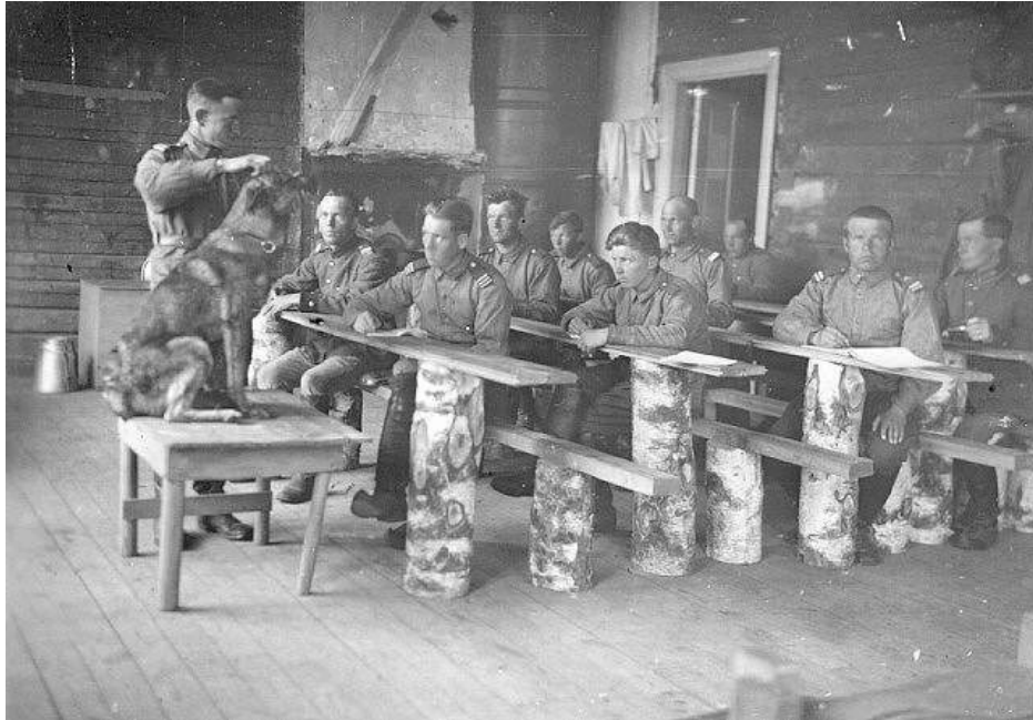
Koirakoulu Orusjärvellä vuonna 1928.